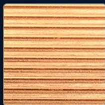
Efficient heat sink