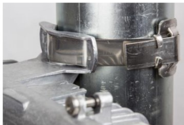
Ø ≥ 19 mm nekonečný kovový pásek, spona apod. (max. šířky 19 mm, není součástí balení)