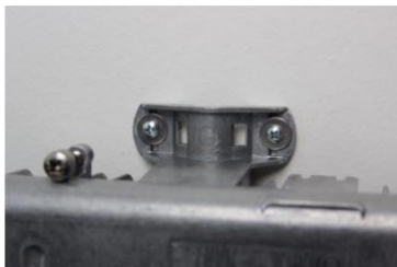
na stěnu (montážní materiál není součástí balení)