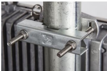
Ø 21 - 54 mm třmen (součást balení T)