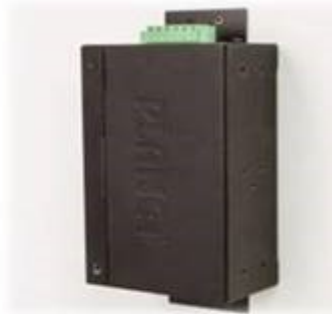
Wall mounting (Space saving)