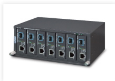
Media Chassis Installation