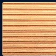
Efficient heat sink