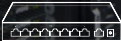
TL-SF1009P ( Extend Mode Off )