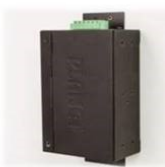
Wall mounting (Space saving)