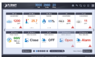
Complete Data Report