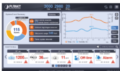
User-friendly Dashboard Design

Je vybaven centralizovaným inteligentním rozhraním pro správu, které je navrženo tak, aby bylo intuitivní a uživatelsky přívětivé. Toto rozhraní poskytuje komplexní ovládací panel, který nabízí monitorování a správu všech připojených zařízení IoT v reálném čase. Díky přehledným vizualizacím a snadno ovladatelným nabídkám mohou uživatelé rychle přistupovat k důležitým informacím, analyzovat data a přijímat informovaná rozhodnutí.