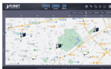
Centralized Management of IoT Devices