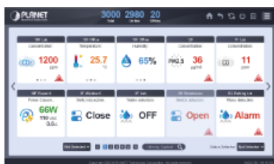
Complete Data Report